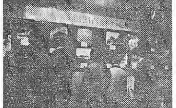
修学旅行の写真展

千葉 船橋市で修旅研修会 一昨年から同市中央公民館で修旅研修会を開催、全市から中学校長をほめて修旅担当教師約三十名が