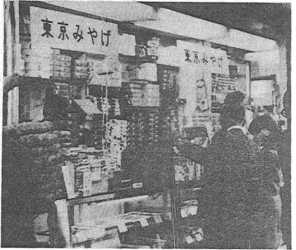
写真に「なかなみやげ品の店頭。良心的な店では不良品を押し出している。(上野駅付近)

修学生は、なんともいえないみやげ品。このみやげ品の大半は、これらのお土産にあらわされてきた。みやげ品は、この世論にこたえて、公正な取引を求め、メーカーも自主的に悪徳業者の追放に積極的な姿勢を示している。では、みやげ品をめぐる話題をめぐらしてみよう。 公正取引委員会は、このほど消費者や製造業者代表を集めて、みやげ品の品質検査を開いた。検査結果は、表示不良十五、表示や木製で全体の約八割が不良品の烙印を押された。不良品は羊かん、せんべい、もち菓子などの食品ばかりだが、菓子類は古くからいわれるだけあって、悪徳業者の横行が著しい。悪徳業者の横行が著しい。悪徳業者の横行が著しい。