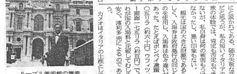
ルーブル美術館の筆者

パリは北緯四八度、西経二度、北緯の緯度は四度であることと比較すれば、メキシコ暖流の影響は極めて大である。私が立ち寄った六月十七日(二十日)の朝は、阪神間でいえば五月中の気候で、まことに温和、花のバリエーションも豊富であった。 パリに直結する私の観念は、ヨーロッパの概念の中核であるところから、フランス革命とナポレオンというところになる。そして先年日本にきたミロのウィナスをルーブル美術館にみにいきたいというところであった。 セーヌ河に影をうつしたノートルダム、モンマルトルの丘のサクレール寺院の広場からのパリの眺望など絵葉書でおなじみであるが、ルーブル美術館の前から、カール・ゼル・凱旋門を背にしてテュイルリー公園を透し、コンコルド広場のオリベスクとエトアル広場の有名な凱旋門を一直線に結ぶ眺めはパリそのものというべきである。 パリのガイドの説明を通じて意外に感じたことは、ナポレオンをフランス第一等の国民的英雄として誇りに礼賛すること、都市計画・美術的感覚において保守主義を固執していること、メイド、清掃人などの職業を蔑視し、フランスの自由主義も限定的であることなど、やはり意外であった。 この驚いたことがルーブル美術館で起こった。ハイビルは「遠慮下さい」ということを必す要する。レディ・ファーストの原則に、ハイビルをぬがなければ、ルーブル美術館には入れない。ハイビル美術館には入れない。ハイビル美術館には入れない。ハイビル美術館には入れない。