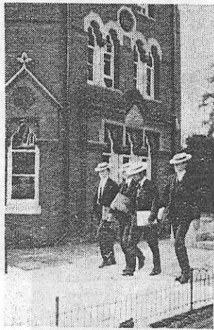
カンカン帽のハロウの生徒

都として資本主義のシンボリックなものである。私の外国旅行の最初の到着地としての貴族は十分なはずである。 四十二年五月二十七日七時三十分ヒースロー空港は小雨に煙っていた。六月二十日帰国のとき、パリからの飛行機がヒースロー空港に寄港したときも小雨、まさにロンドン霧の都、雨傘は必需品のようである。雨のロンドンではパキンガムの衝突交際の風景を見ることのできたが、チームス川の左岸から雨にぬれている国会議事堂とウェストミンスター寺院の遠望はすばらしいかった。