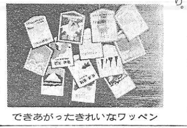
できあがったきれいなワッペン

科学技術館八万人。これは、四月二十五日(水)から四月二十八日(土)まで、三泊四日の輸送計画をたてた。