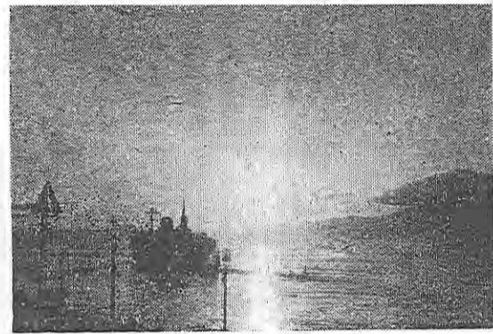
出港 及川 澄先生 (岩手)