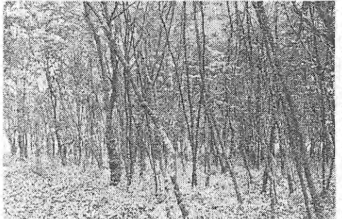
武蔵野の草深い風土に咲く花。写真は平林寺の雑木林。

たに花を咲かしたのに「私を見捨ててしまった」という第二首いかにも武蔵野らしく色に染み出た。第一首の沈んだ嘆きに、なによりこの詩が愛をうけて入って来ないように、「別れたあの日以来夫に会わな」と嘆く妻の思慕の情をうたったのが第一首である。無論武蔵野風その素朴純粋な恋愛の情にはかわりがない。