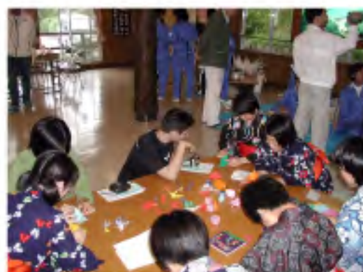
③ 着物の着付け・折り紙