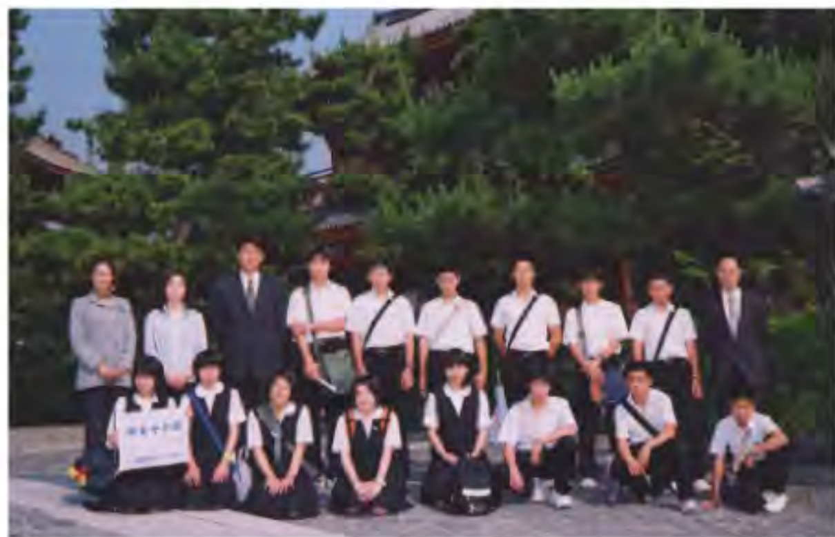
神泉村立神泉中学校 平成14年度修学旅行記念 於 大徳寺

京都・奈良は日本の文化が生まれ、歴史の舞台となった日本の古都です。お寺や仏像、神社や庭だけでなく、町並みや風景一つひとつからも歴史と伝統が感じられる。また、修学旅行では、グループで見学したり、友達と一緒に風呂に入り、食事をし、自由におしゃべりを楽しむ時間もある。教師は支援・援助に心がけ、生徒が主体的に課題に取り組み創り上げる活動となるように留意し、生徒が何を学習すべきか、一人一人に確かな学習意欲を持たせ、実際に見聞きし、自然や文化に接し、多くの人達と交流を図ることにより充実した修学旅行になると考え、本テーマを設定した。