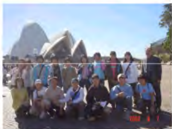
シドニー オペラハウス前