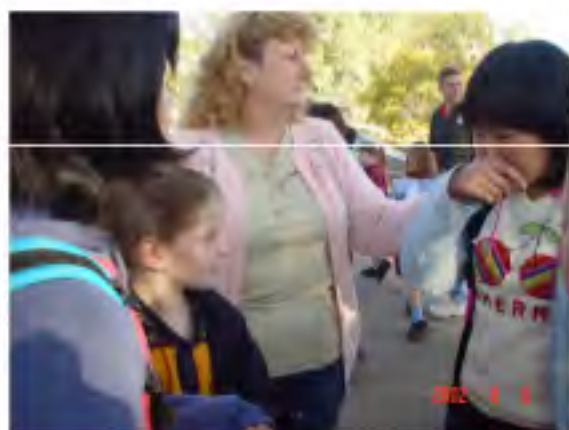
ブリスベン ホームステイの家族とお別れ