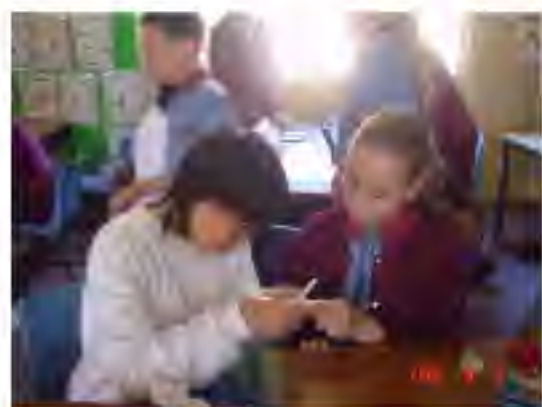
ブリスベン 折り鶴を教えています