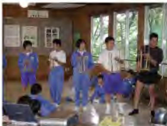
インドネシアの楽器で演奏