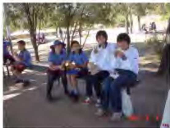
ブリスベン ランチは外で一緒に

最後になりますが、私たちの海外研修を最高なものにするために頑張ってくれた皆さん、本当にありがとうございました。