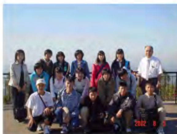
ブリスベン マウントクーサの丘