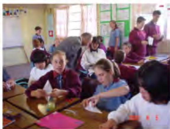
ブリスベン 現地の学校で一緒に授業