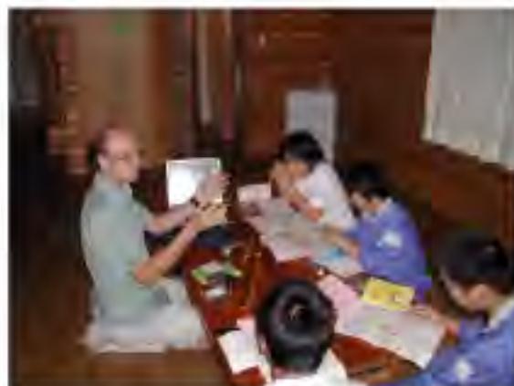
バンガローでの学習

私達は文化的な活動をやってみせることで、自分の村に誇りを持てた感じがした。それ以来私は自分の村に興味を持ち続けている。しかし国際化とは何だろうか。他国の文化や歴史について学ぶことだろうか。たしかにそれも一部だろう。私は国際化とは、ただ、単に情報を受け取るだけでなく、受け取った分以上に何かを返していくことだと思う。私達は自分の故郷に誇りを持つべきだ。そうすれば自信を持って他国の人達に教えることができるだろう。