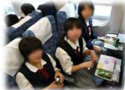
〈新幹線内での静岡茶〉