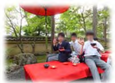
〈京都で味わう宇治茶〉