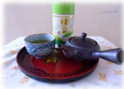
〈〈自宅で味わう狭山茶〉〉

全国にはいくつかのお茶の産地がありますが、その中で狭山茶を産する埼玉県は緑茶生産の経済的北限とも言われている。また、「狭山茶摘み歌」にも歌われているように、埼玉県の狭山茶・静岡県の静岡茶・京都宇治茶については、生徒たちも名前はよく知っているようである。そして、地域がら「狭山茶」こそが日本で一番おいしいお茶であると小さい頃より、よく聞かされてきている。そこで、修学旅行中に三大銘茶を味わい比較することができないかと考えた。具体的には、1日目の朝、または3日目帰着後に自宅で狭山茶を味わい、1日目・3日目の新幹線内で富士山を見ながらお弁当と一緒に静岡茶を飲み、2日目の班別行動で宇治茶の香りを体感しようという企画を立てた。