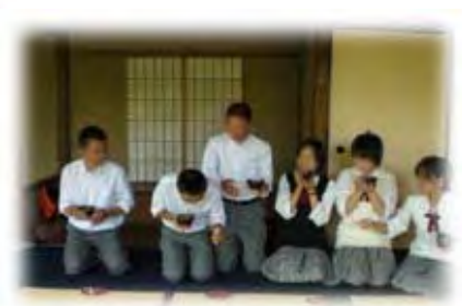
〈班別行動中にそれぞれの場所・時間・費用で体験〉

2日目班別タクシー行動中に、「宇治抹茶を味わう」時間を班ごとに30分程度設定した。自分たちの立てた行動計画に支障が出ない程度で、お茶との触れ合いの場を設けるというものであった。班によっては、自分たちで事前に調べた場所(ガイドブックやインターネット等を活用)に行ったものもあれば、タクシーの運転手さんのお薦めの場所に連れてってもらい、「宇治抹茶」を味わう機会を満喫することができていたようである。特に、京都の街を知り尽くした運転手さんは、生徒たちが作成した行動計画を予め把握しており、お店の混み具合等を配慮して生徒たちにゆったりとお茶を味わう時間を作り出してくれた。