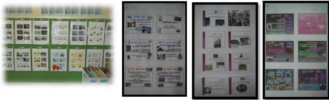
〈教室の後ろに掲示されたプレゼンテーション資料の様子〉

後は、発表内容、画面の見やすさ、パワーポイントの工夫などを5段階評価し、各クラスの代表者を1名決定した。さらに、各教室には普段は個人新聞等を入れるクリアファイルの中にプレゼンテーション資料が掲示され、後日行われた保護者会等で、多くの方に見ていただくことができた。