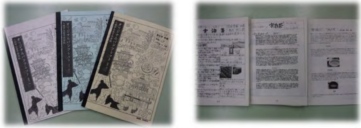
〈クラスごとに作成されたガイドブック〉〈ガイドブック内の宇治抹茶についてのページ〉

りのため ④「調べ学習」「資料のまとめ方」「発表」がさらに上手になるため等である。具体的には、事前に指定された「京都の名所」「京都の文化」「奈良の名所」「奈良の文化」の中から一人で「1つ」を担当し、さらに班全員で協力して作成するものも含まれ、クラスごとに1冊の冊子をつくりあげた。調べる手だてとしては、各クラスに配られる「修学旅行関係の本・雑誌」「学校のパソコン」「各家庭にある資料」「家の方や先輩、先生方からの情報」をもとにB4サイズの新聞形式でまとめを行った。生徒たちは、この自作のガイドブックをもとに、2年時中に各自の「修学旅行2日目おすすめ行動プラン」を作成。新年度4月後半に新クラスでの修学旅行班が編成されたのち、それぞれのクラスで作成されていた班員のプランを自分のプランと比較検討しながら、「京都市内班別タクシー行動」の計画を完成させていくために活用された。