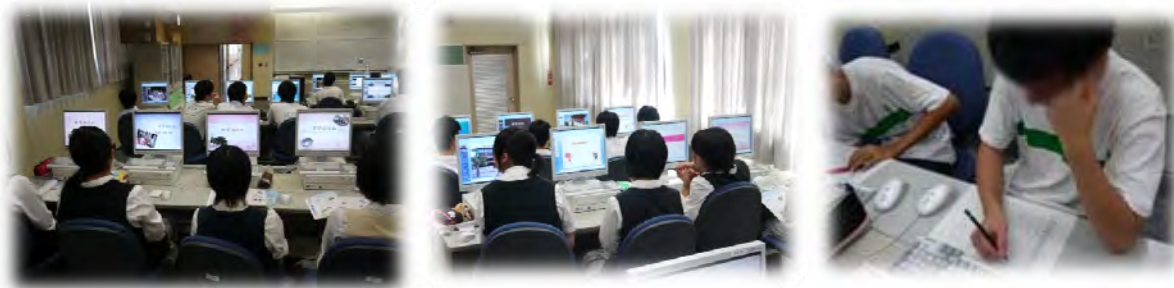
〈コンピューター室での作成風景〉