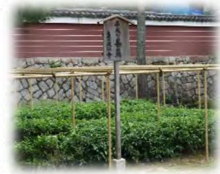
〈建仁寺内にある、茶碑と茶園〉

※茶は、今日では日本人の日常生活に欠くことのできない飲料であるばかりではなく、茶道の興隆と共に東洋的精神の宣揚にも役だっています。建仁寺開山・栄西禅師が日本の茶祖として尊敬されるのはそのためです。〈建仁寺ホームページより引用〉